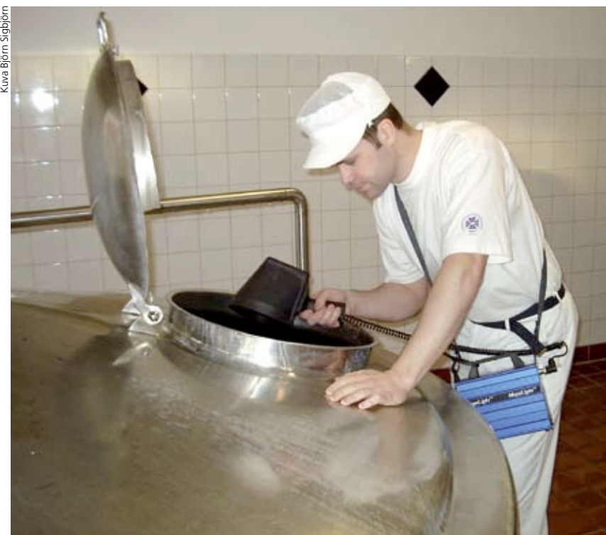
Maitosäiliötä tutkitaan UV-lampulla Milkon meijerissä Ruotsissa.